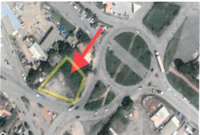
Foto aérea, localização com grande circulação de veículos, de esquina.

Terreno cercado por tapumes, no nível da rua com frente à av. Prefeito Alberto Moura.